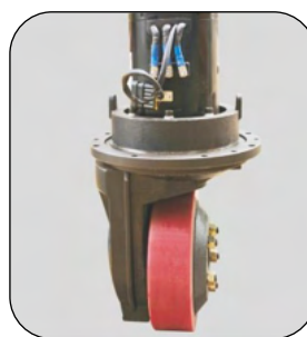
Motor de tracción vertical